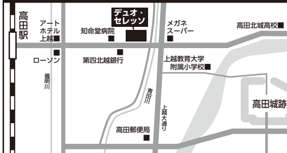
【図1】デュオ・セレソン案内図

《所在地》新潟県上越市西城町3丁目5-20 【自家用車】 長岡・新潟・富山方面より ・北陸自動車道上越IC下車、国道18号を長野方面へ。 ・寺IC又は四ヶ所ICを上越大通り方向へ。(上越IC下車後、約10分) 長野方面より ・上信越自動車道上越高田IC下車、上越大通り方面へ。 ・上越大通りを高田駅方向へ。(上越高田IC下車後、約10分) 【電車】 えちごトキめき鉄道「高田駅」より徒歩約7分